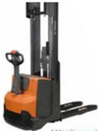
Mât télescopique double (ou triple)